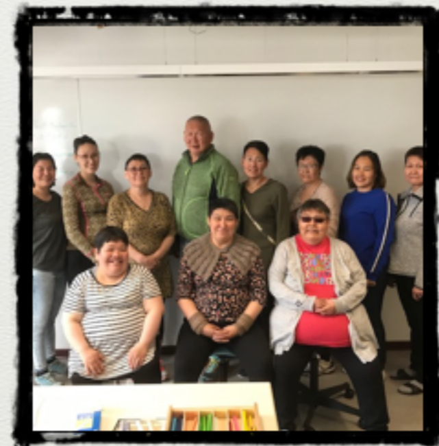
Holdet fra Maniitsoq juni 2020

Coaching møderne foregår enten som personlige møder i din arbejdsplads eller via telefon / Skype, hvor du får sparring i dine ledelsesudfordringer / hjemmeopgaverne som du får under kursusdagene.