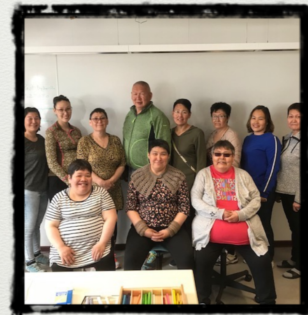
Holdet fra Maniitsoq juni 2020

Coaching møderne foregår enten som personlige møder i din arbejdsplads eller via telefon / Skype, hvor du får sparring i dine ledelsesudfordringer / hjemmeopgaverne som du får under kursusdagene.